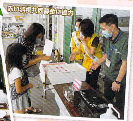
赤い羽根共同募金に協力