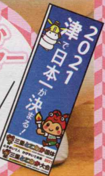
表紙 津うキャラたちととこまるが集まって運動会を開催♪(11月5日 芸濃総合文化センター)