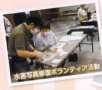
水害写真修復ボランティア活動