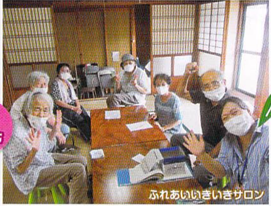
ふれあいいきいきサロン