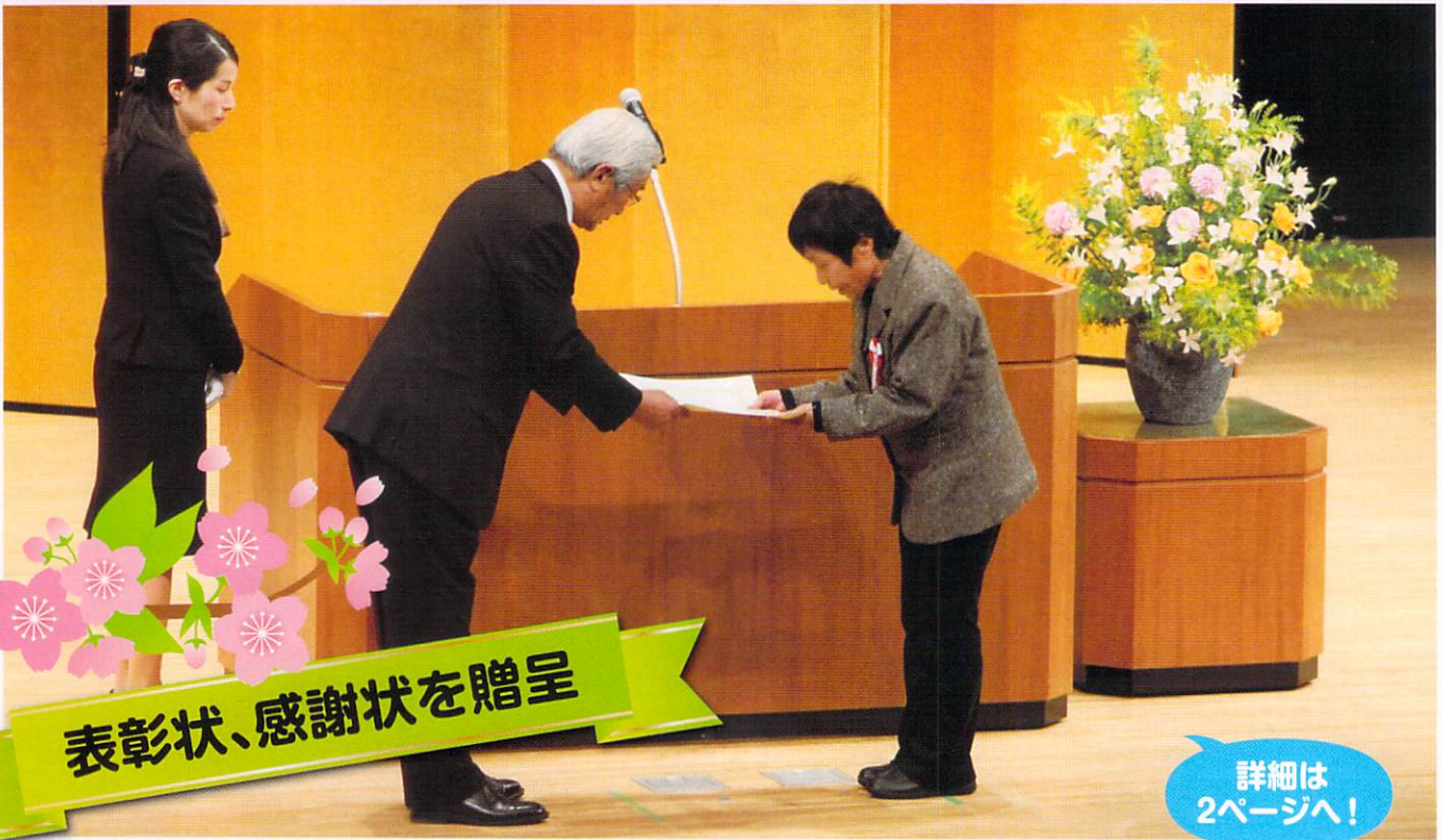
表彰状、感謝状を贈呈